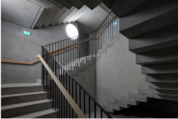
Bild 4: Die optisch ansprechende Rundleuchte ONDARIA setzt im Stiegenhaus starke Akzente und sorgt für ein wohliges und stimmungsvolles Ambiente.