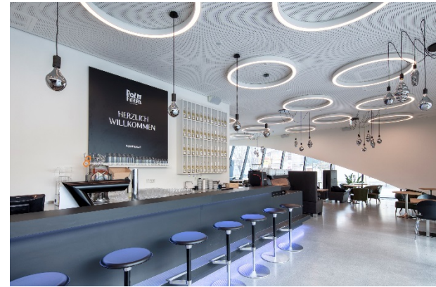
Bild 2: Die projektspezifischen Ringleuchten und Downlights mit tunableWhite-Technologie schafft eine natürliche und entspannte Atmosphäre.