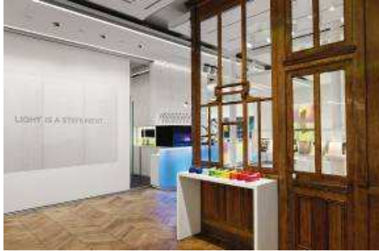
Bild 3: Die gesamte Bandbreite an Möglichkeiten, um Waren und Objekte mit Licht zu inszenieren kann der Besucher authentisch und eindrucksvoll erleben.

Bild 2: Unverkennbar ist das puristische Zumtobel Design, das gleichzeitig das Charisma des historischen Gebäudes geschickt integriert.