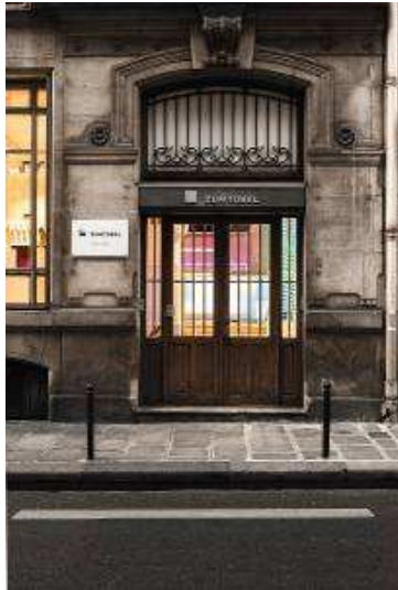
Bild 1: Das neue Lichtzentrum „La Lumière d'Uzès“ ist dank zentraler Lage schnell und einfach erreichbar.