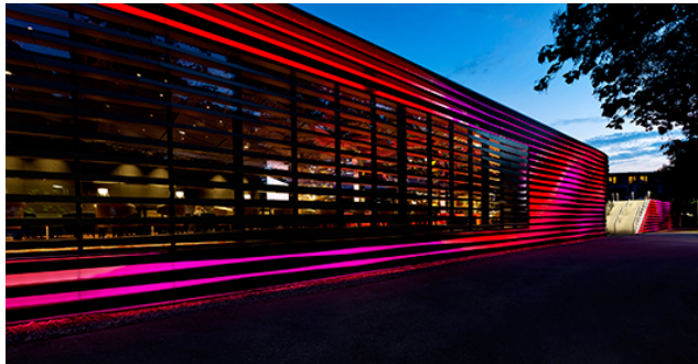
Bild 1: Das Casino Bregenz wurde in zwei Bauabschnitten erweitert und erhielt eine neue Fassade.