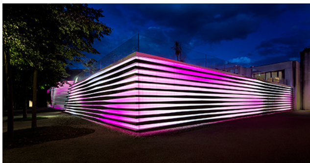
Bild 2: Bei Anbruch der Dunkelheit bringt die LED-Medienfassade CAPIX evolution das Casino zum Leuchten.