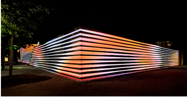
Bild 4: Bei Bedarf kann der Ablauf der Fassadenbespielung auch kurzfristig geändert werden.