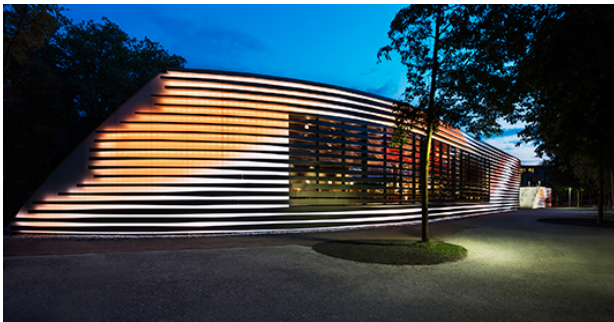
Bild 5: Neben der Gestaltung von Farben und Effekten können über CAPIX evolution mit einer Steuerung auch bewegte Bilder abgespielt werden.